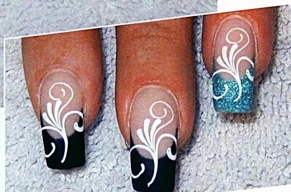
2 Stempeln Sie mit Schablone und weißem Stampinglack ein Ornament auf.