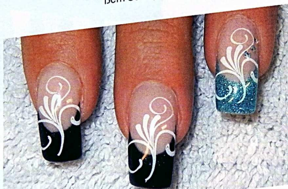
4 Versiegeln Sie die Modellage und härten Sie vollständig aus.