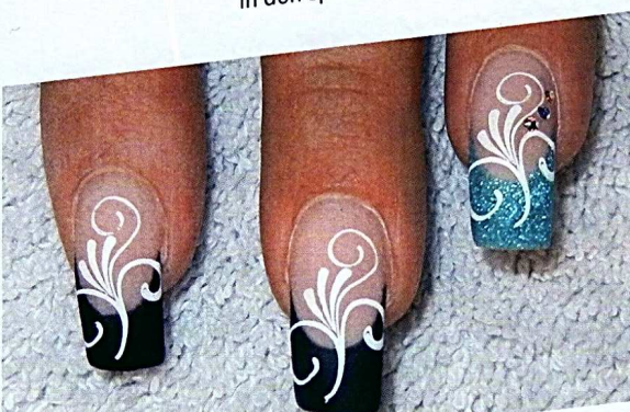
3 Kleben Sie ein paar Strasssteine in verschiedenen Größen auf.