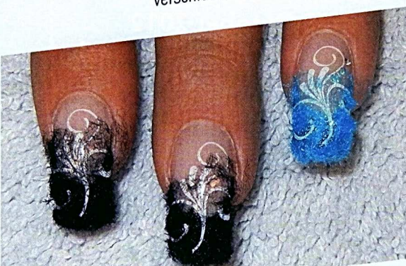
5 Tragen Sie erneut Gel auf das French auf und streuen Sie Samtpulver auf.