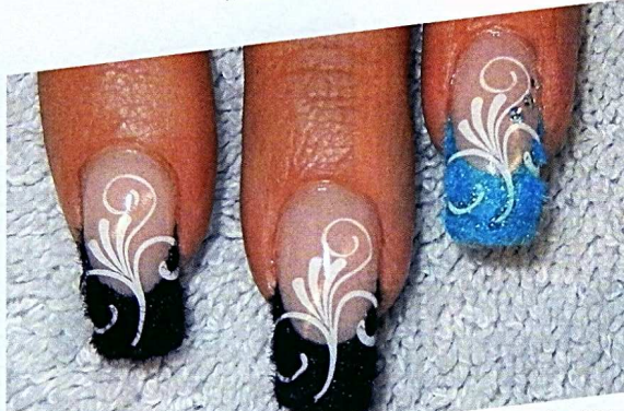
6 Härten Sie vollständig aus und bürsten Sie das überschüssige Samtpulver ab.